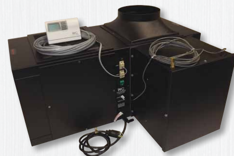
Abbildung zeigt ein System mit optionalem, integrierten Luftbefeuchter