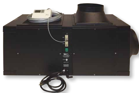
Seitenansicht der Steuerung