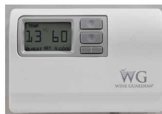
Das Benutzer-Kontrollsystem mit Fernzugriff zeigt die Temperatur in Grad Fahrenheit oder Celsius an