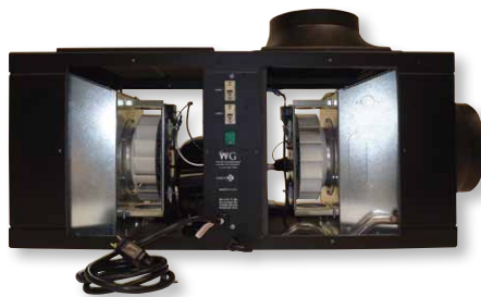
Seitenansicht mit Standard-Manschetten für den Eingangs- und Rückkanal (Abdeckungen entfernt)