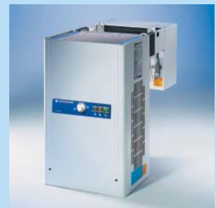
Huckepack-Aggregat mit T-Regelung