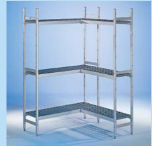
Aluminiumregal Rega Almo