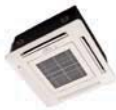
RAI-25-50NH5A (mit Blende RAI-ECPM)