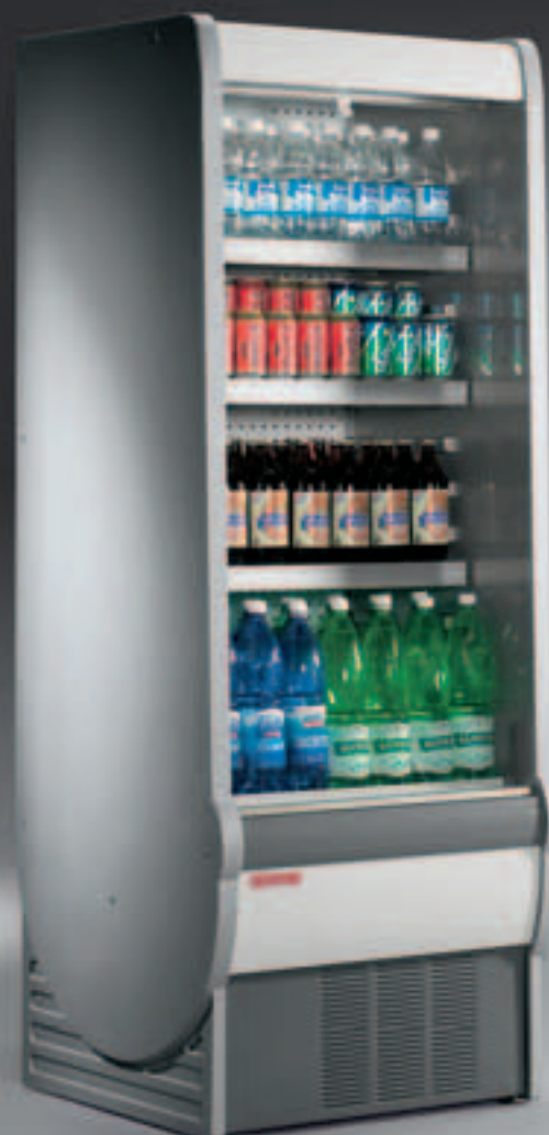
fincata standard standard endwall joue standard Standard-Seitenteil lado estándar Стандартная боковина